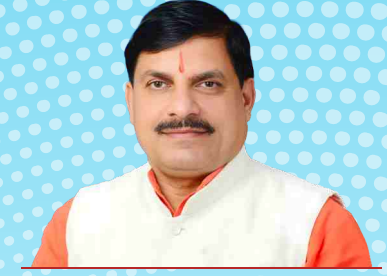
डॉ. मोहन यादव, मुख्यमंत्री