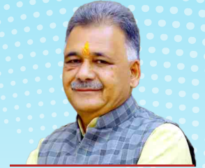
इन्दर सिंह परमार मंत्री, उच्च शिक्षा विभाग मध्यप्रदेश शासन