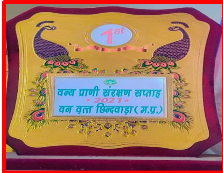
First Prize in District Level Painting Competition